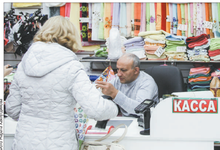
Бракованный товар подлежит возврату, с возмещением потребителю всех расходов

тогда потребитель провела экспертизу за свой счет. В результате заключение экспертизы показало, что дефект – прорубка трикотажного полотна подкладки платья является дефектом скрытого производственного характера, который проявляется только в результате эксплуатации изделия. Он образовался в результате неправильного подбора иглы по номеру к толщине трикотажного материала и захват материала подкладки в шов соединения верхней и нижней частей платья выполнялось затупленной иглой. Изделие (женское платье) с прорубани-